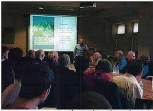
בקרוב עומד לא תרגום לעברית של הספר. תומלץ